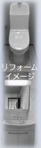
リフォームイメージ